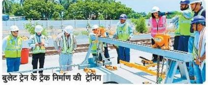
बुलेट ट्रेन के ट्रैक निर्माण की ट्रेनिंग

सूरत @ पत्रिका. मुंबई-अहमदाबाद बुलेट ट्रेन परियोजना के लिए सूरत में भारतीय इंजीनियरों और वर्क लीडर्स के लिए ट्रैक निर्माण प्रशिक्षण मॉड्यूल पूरा कर लिया गया है। यह 20 दिवसीय ट्रेनिंग प्रोग्राम स्लैब ट्रैक और सीमेंट एस्फाल्ट मोर्टार (सीएएम) इंस्टालेशन पर आधारित था। नेशनल हाई-स्पीड रेल कॉर्पोरेशन (एनएचएसआरसीएल) की ओर से बताया गया कि सूरत में हाई-स्पीड रेल ट्रैक इंस्टालेशन प्रशिक्षण के लिए विशेष रूप से निर्मित ट्रैक